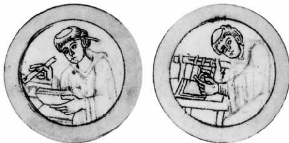
Рис. 2. Писец с пером, засунутым за ухо, линует страницу (слева); переплетчик, сшивающий тетради в кодекс (справа). Начало XII в.

рукописей (Г. Грегори, А. Дэн, С. Дер Нерсессиан, Ж. Леруа, К. Вейцман, А. П. Каждан, В. Д. Лихачева, Б. Л. Фонкич, М. В. Бибииков и др. 4 ). В 1997 г. увидела свет монография А. Джуровой, посвященная кодикологии югославянских рукописей в связи с влиянием на них византийской книжной и письменной традиции 5 .