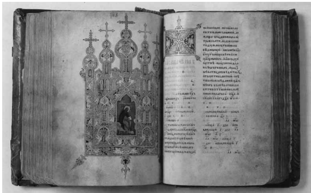
Рис. 7. Онежская псалтирь 1395 г. (разворот)

грамот, памятников делопроизводства, эпистолов и пр., тогда как кодикология занимается исследованием только рукописных книг.