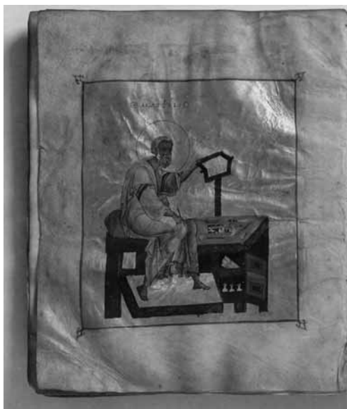
Рис. 6. Греческое евангелие XI—XII вв.

писцов, особенностями разлиновки, структуры текста и т. д. Предметом кодикологии является история скрипториев и книгописных школ, что объясняется необходимостью изучения внешней и внутренней формы кодексов, важных для установления места и времени их изготовления, а также их писца, заказчика и владельца. Установление переписчика в кодикологии как и в палеографии далеко не всегда предполагает определение его имени. Оно учитывает, прежде всего, возможность разграничения разных почерков в рамках одной рукописи и установления общих почерков в разных кодексах.