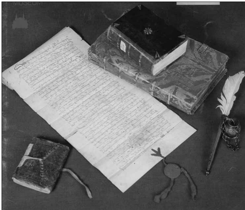
Рис. 5. Древнерусские рукописные книги и грамота с привешенной к ней печатью

По специфике методических приемов, применяемых к рукописным сборникам, текст которых написан на разных материалах, следует различать кодикологию пергаменных рукописей, кодикологию рукописей на бумаге и кодикологию рукописей, в которых пергамен и бумага употреблены вперемежку. В кодикологии пергаменных и бумажных рукописей особое внимание уделяется исследованию внешней и внутренней формы кодексов, имеющих точную дату. Изучается происхождение отдельных кодексов и их групп, выявляется существование древнерусских скрипториев, производится идентификация отрывков рукописных книг и атрибуция анонимных кодексов. Устанавливаются характерные признаки кодексов, произведенных в определенных рукописных центрах (по особенностям разлиновки листов и приемам нанесения ограничительных линий, по принципам складывания листов в тетради, методам разрезания листов, по качеству и способам выдел-