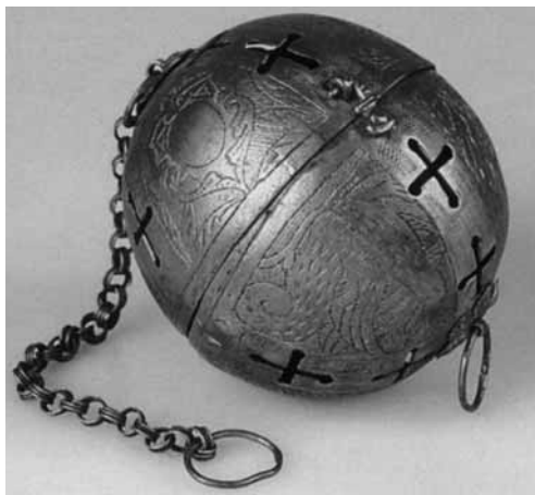
Рис. 4. Шар для обогрева рук писца, XV в., Италия

Следует согласиться с Л. И. Киселевой, относящей к предмету кодикологии не только рукописную книгу как таковую, но и комплексы рукописных книг, изучение внешней и внутренней формы которых служит основой для установления особенностей книгопроизводства в рамках отдельного скриптория или писцовой школы 14 .