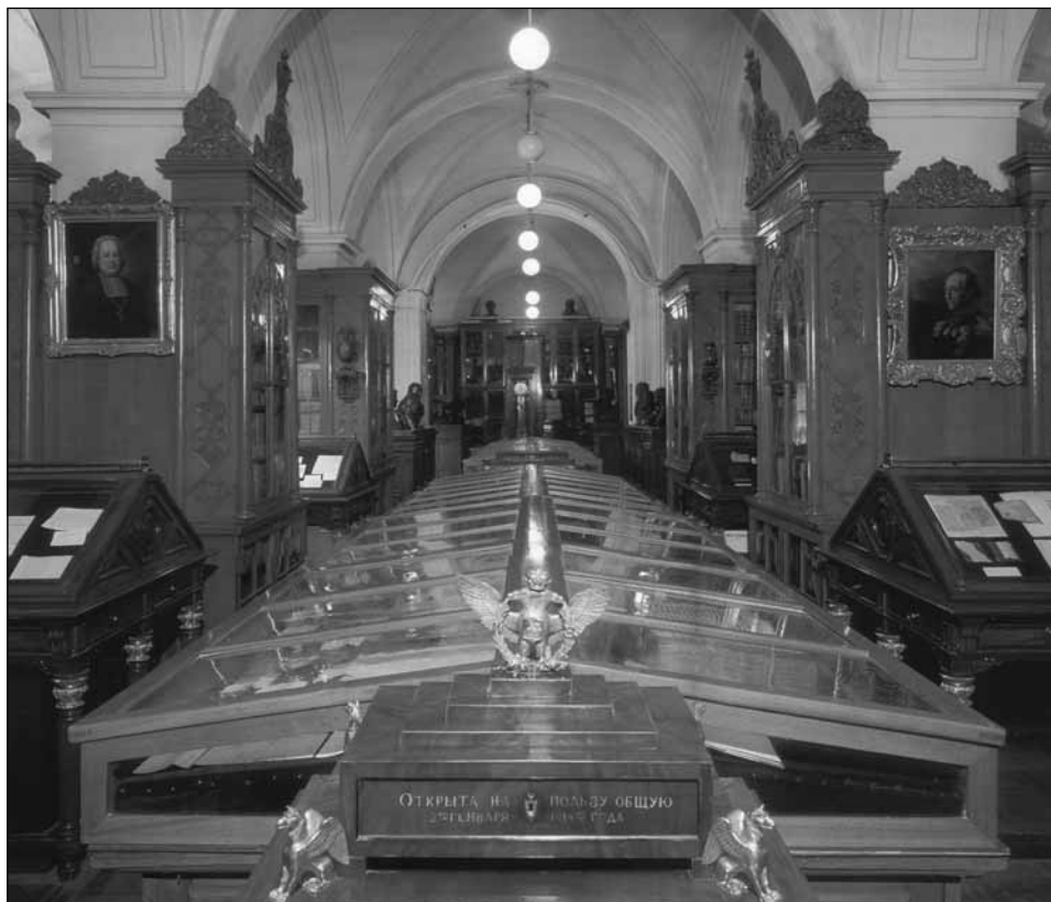
Рис. 1. Отдел рукописей Российской национальной библиотеки (С.-Петербург)

научной дисциплины стало результатом дифференциации и вместе с тем синтеза целого ряда историко-филологических дисциплин (источниковедения, палеографии, филиграноведения, текстологии, искусствоведения, архиво- и библиотековедения, археографии). В наше время кодикологические исследования представляют одно из приоритетных направлений медиевистики.